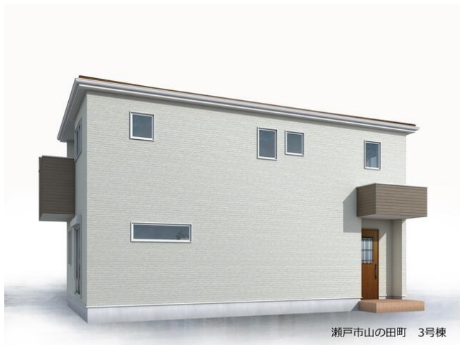
瀬戸市山の田町 3号棟